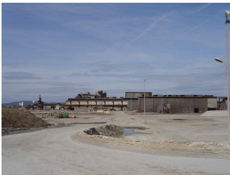
Illustration 2: Le site industriel de Laudun L'ardoise

Il s'agit d'une zone industrialo-portuaire pour laquelle les enjeux d'aménagement sont apparus importants et les bénéfices d'un stockage des crues limités : dans le scénario 2, l'hypothèse retenue serait de garantir la mise hors d'eau du site.