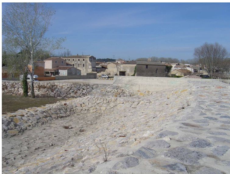
Illustration 4: Le déversoir de Comps sécurisé après la crue de 2003 (Ouvrage CNR)