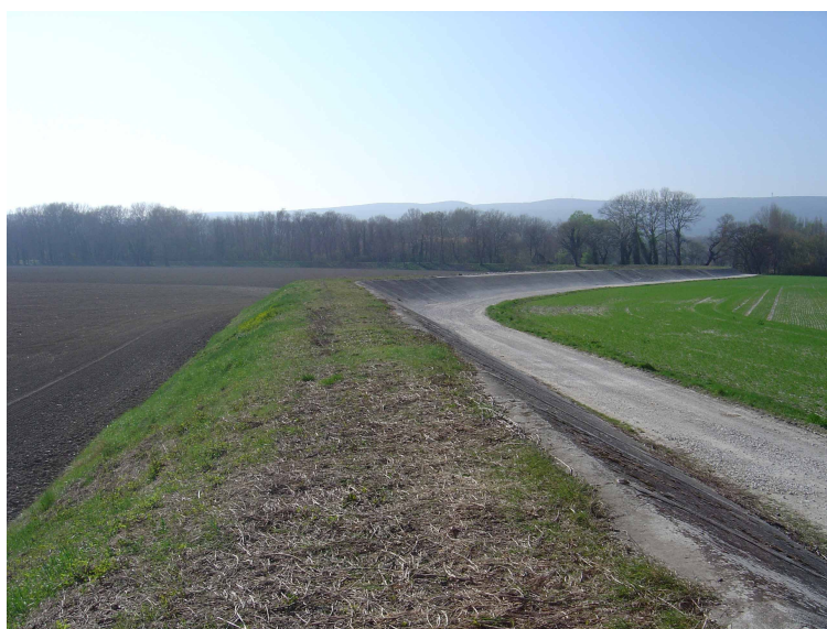
Illustration 1: Un des ouvrages de gestion des inondations de la plaine de Donzère-Mondragon.

Il s'agit d'une grande plaine agricole de 10500 ha environ 13 , avec une variété de cultures (vignes, vergers, légumes de plein champ, ...) et comprenant de l'ordre de 170 exploitations. Les bâtiments agricoles et les habitations présents de manière éparse dans la zone sont en général aménagés pour résister aux crues : les secteurs inondés sont pratiquement inconstructibles (seules sont autorisés les aménagements des bâtiments existants) car situés dans des zones rouges et vertes du PPRi approuvé. L'abaissement limité de la ligne d'eau envisagé ne permettrait pas d'établir la constructibilité de ces terrains. Il n'a pas été signalé de demande