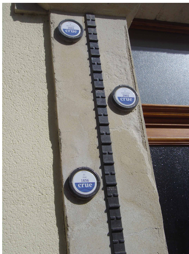
Illustration 5: Repères de crue sur la mairie Comps, commune située à la confluence du Gard et du Rhône. On note que les crues historiques les plus importantes (1840 et 1856) ont moins inondé la ville que les crues les plus récentes : la réduction des zones d'expansion des crues, les ruptures de digues en 1856 et les aménagements hydrauliques du XX ème siècle peuvent expliquer ce phénomène

C'est dans cette zone en que le Rhône reçoit ses derniers affluents importants, de régime cévenol (Ardèche, Cèze, Gard) et méditerranéen (Durance, Ouvèze). Par ailleurs, les usines et ouvrages de la CNR répartissent les débits entre des canaux de dérivation et le lit mineur du fleuve fixé par ces aménagements, le Vieux Rhône. Deux de ces ouvrages peuvent d'ailleurs être considérés comme donnant des limites hydrauliques du projet de ZEC, au nord, l'usine de Donzère, au sud, celle de Vallabrègues (figure). C'est donc une zone complexe et difficile à traiter lorsqu'il s'agit de définir des aménagements hydrauliques destinés à moduler la propagation d'une crue du nord au sud.