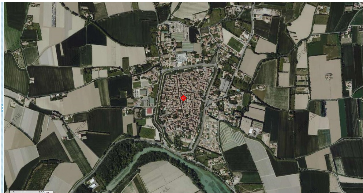
Illustration 3: Le village de Caderousse, entouré de sa protection construite après la crue de 1856. On note l'extension récente des constructions hors les murs.

Elle représente 2400 ha de terres cultivées comprenant des serres et des cultures spécialisées (43 exploitations agricoles recensées) et de nombreuses maisons d'habitations éparses.