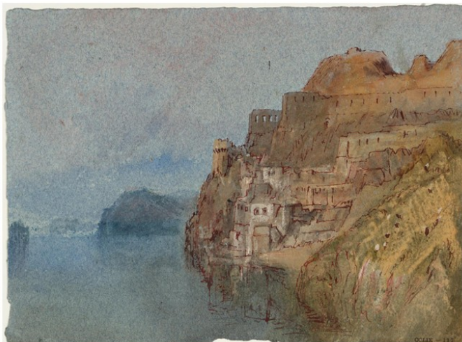
Les folies Siffait aujourd'hui et par William Turner en 1826-28

Au-delà du défilé, les paysages alentours sont exploités depuis longtemps, avec les vignobles des plateaux ou, plus récemment, avec les cultures sous serres, plus à l'ouest dans la plaine de Nantes, accompagnées d'une urbanisation diffuse due à la proximité de la métropole.