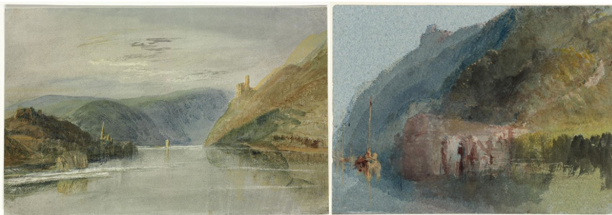
William Turner - à g. Binger Loch et Mäuseturm sur le Rhin (1817) - à d. Péage ruiné à Champtoceaux (1826-28)

Le caractère sombre et sauvage du site frappe de prime abord, en particulier lorsqu'on le contemple depuis le belvédère de la tour de la Marlaisière, sur la rive droite à l'est d'Oudon. La Loire parcourt majestueusement le défilé entre les îles boisées et les bancs de sable, encadrée de rochers de schistes aux teintes rouille, couverts d'une végétation omniprésente. Malgré des dénivelées relativement modestes, de l'ordre de quatre-vingts mètres, l'escarpement des coteaux et l'étroitesse de la vallée surprennent par rapport aux grands espaces lumineux du val de Loire de Touraine et d'Anjou. Nul mieux que William Turner n'a su évoquer, dans les aquarelles qu'il a peintes lors de ses voyages, le romantisme de ces paysages et leur parenté avec ceux du Rhin en Allemagne.