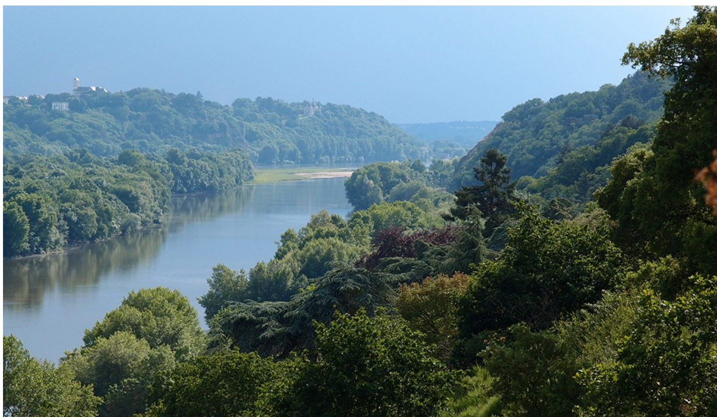
Le défilé et l'église de Champtoceaux vus depuis la tour Marlaisière