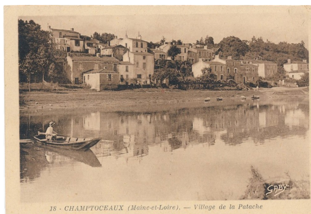
Champtoceaux, hameau de la Patache, ancien port de marinière

Le fleuve était une voie de transport importante, avant le chemin de fer, et porte les vestiges des aménagements liés à la batellerie : seuils, épis, ports, cales, quais, villages de pêcheurs, sont encore visibles en maints endroits. Le site comporte ainsi un ancien port de marinière caractéristique, le village de la Patache. Ses petites maisons, imbriquées les unes dans les autres dans un labyrinthe de ruelles, s'étagent sur la pente dominée par le rocher de Champtoceaux, à l'abri des inondations. Nombre d'entre elles sont aujourd'hui des résidences secondaires.